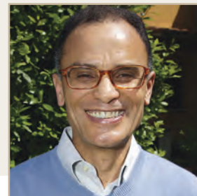
Magdi Cristiano Allam

Fino al 2011 le nostre attività si sono concentrate sull'organizzazione e l'elaborazione del piano di attività. A partire dal 2012, abbiamo saputo offrire ai nostri soci e al pubblico che ci segue in modo sempre più fedele e numeroso, diverse e variegate attività.